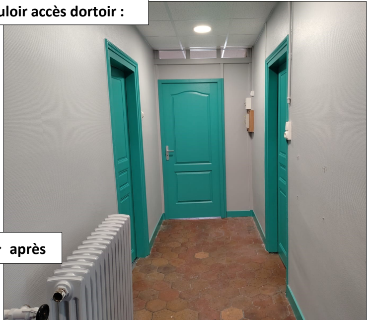
avant → après