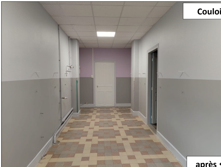
Couloir accès classes :