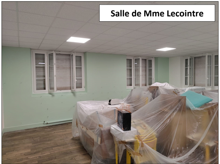
Salle de Mme Lecointre