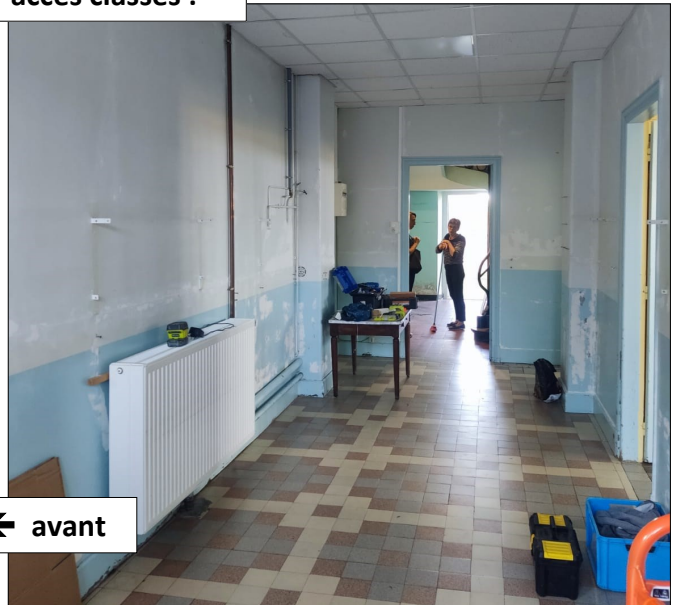
après ← avant