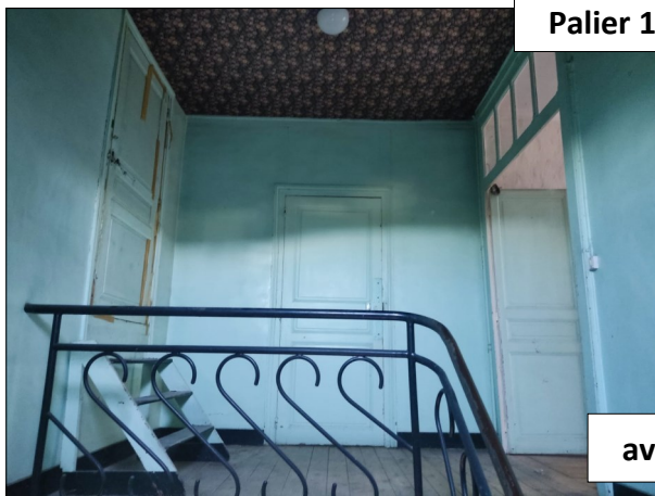
Palier 1 er étage