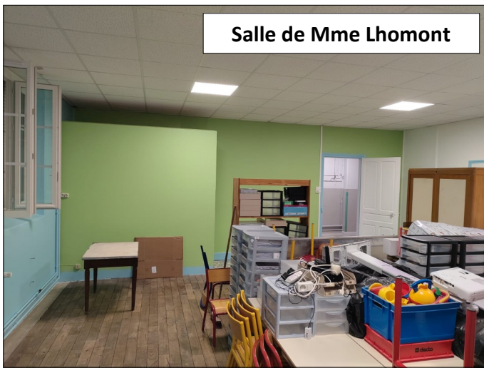
Salle de Mme Lhomont