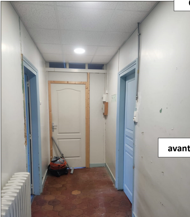
Couloir accès dortoir :

Petits et grands sont ravis du résultat.