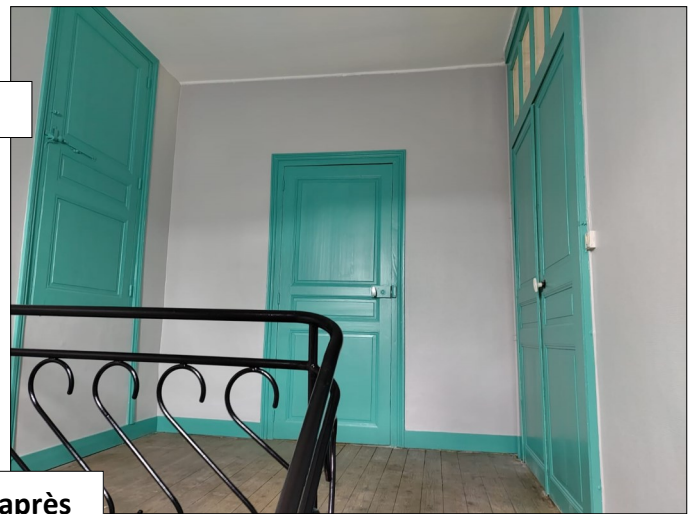
avant → après