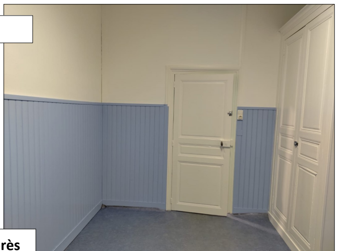
avant → après