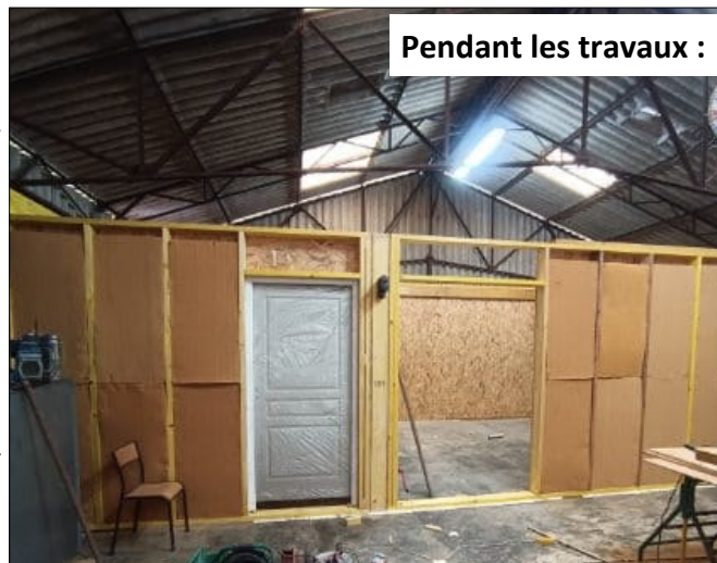
Pendant les travaux :

Vous trouverez ci-dessous, la répartition du financement :